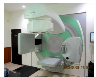
画像誘導放射線治療装置