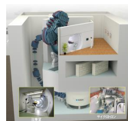
陽子線治療装置(相澤病院)